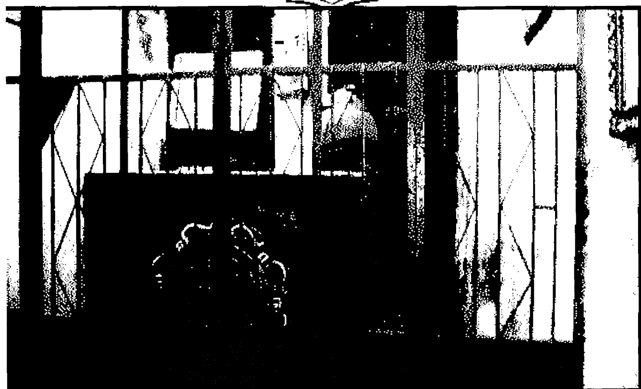
ضريح العارف بالله تعالى سيدى نور الدين الشونى وهو شيخ سيدى عبد الوهاب الشعرانى وهو موجود فى مسجده